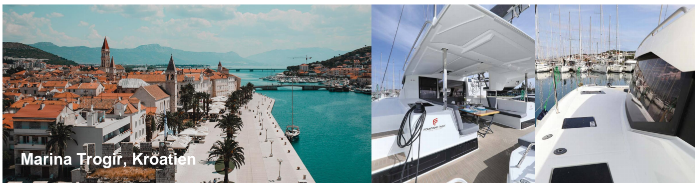
Marina Trogir, Kroatien