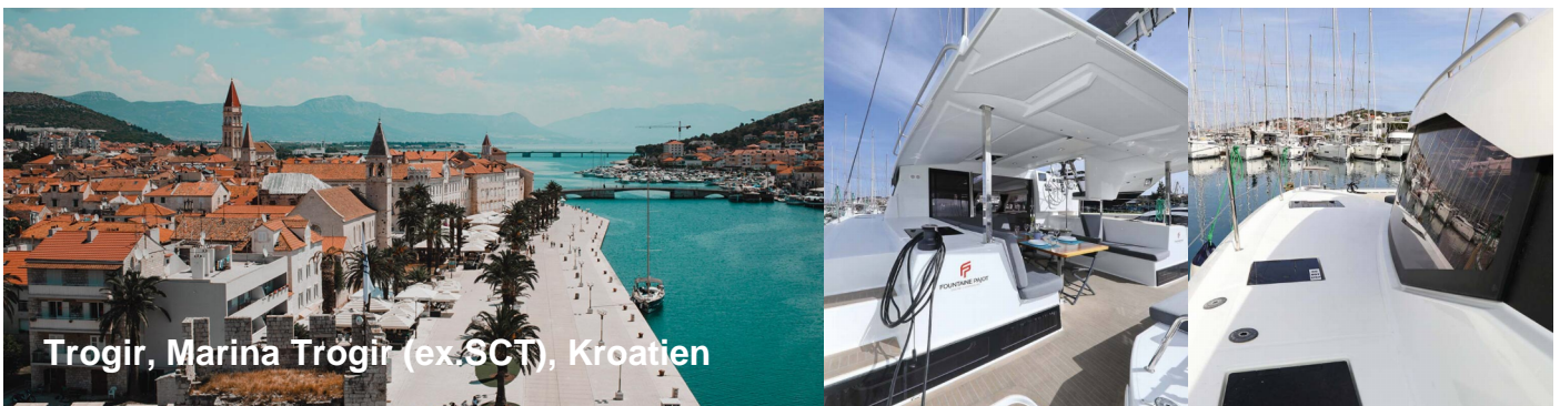
Trogir, Marina Trogir (ex-SCT), Kroatien