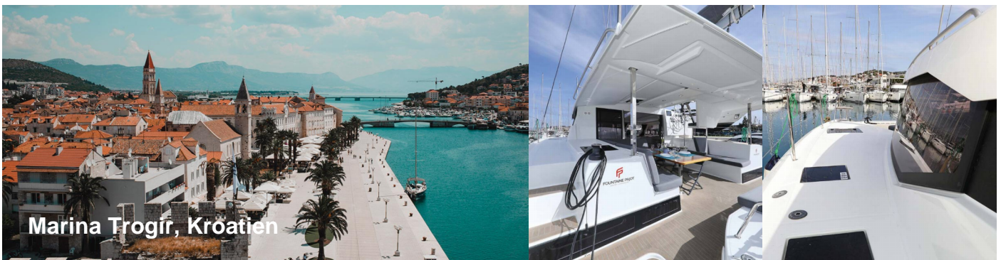
Marina Trogir, Kroatien