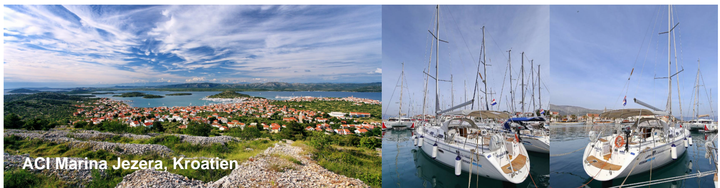
ACI Marina Jezera, Kroatien