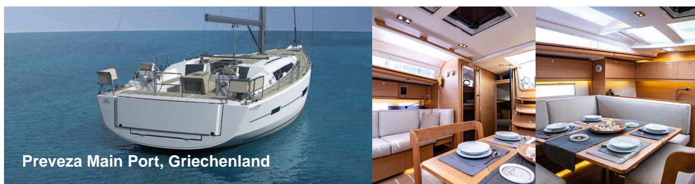
Preveza Main Port, Griechenland