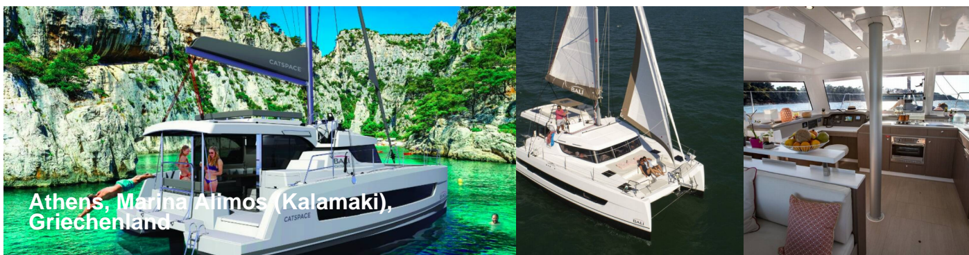
Athens, Marina Alimos (Kalamaki), Griechenland