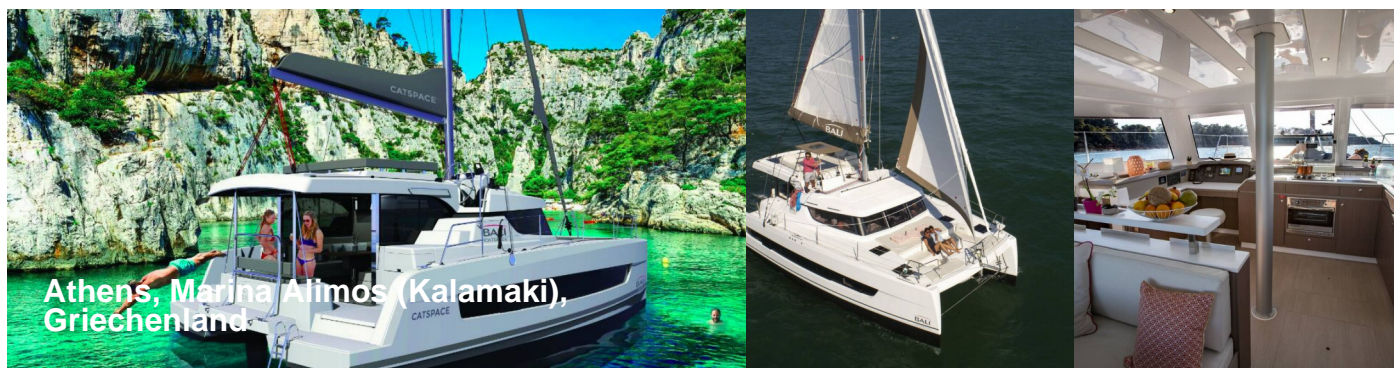
Athens, Marina Alimos (Kalamaki), Griechenland