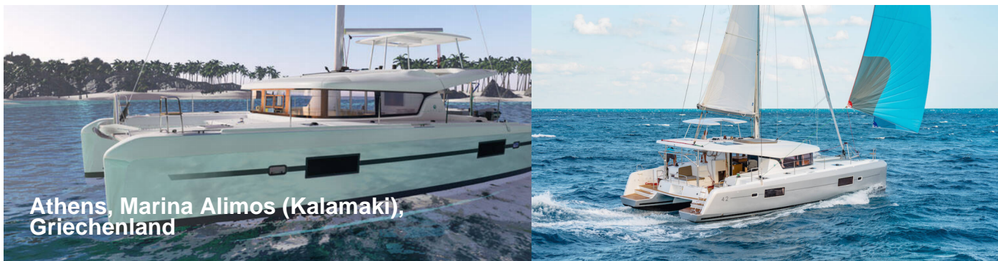
Athens, Marina Alimos (Kalamaki), Griechenland