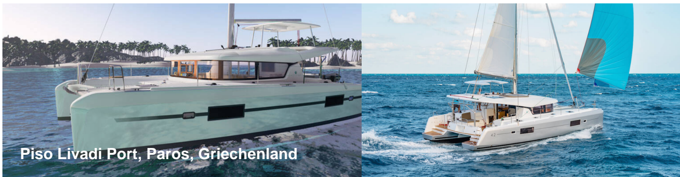
Piso Livadi Port, Paros, Griechenland