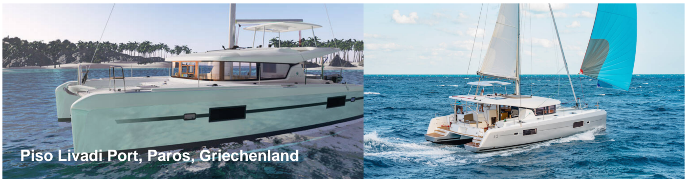
Piso Livadi Port, Paros, Griechenland