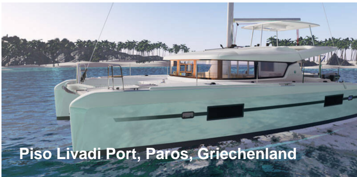
Piso Livadi Port, Paros, Griechenland