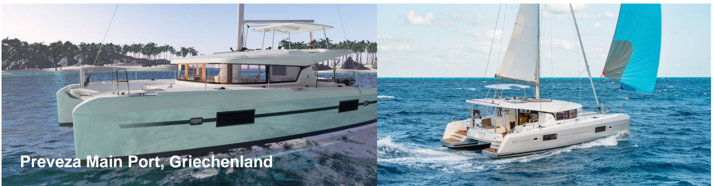
Preveza Main Port, Griechenland