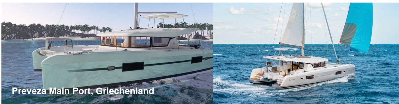
Preveza Main Port, Griechenland