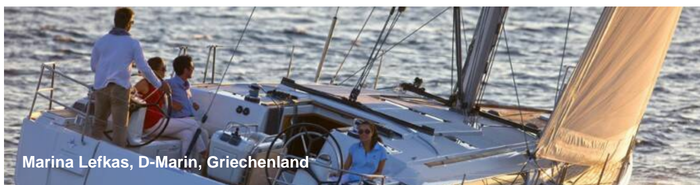
Marina Lefkas, D-Marin, Griechenland