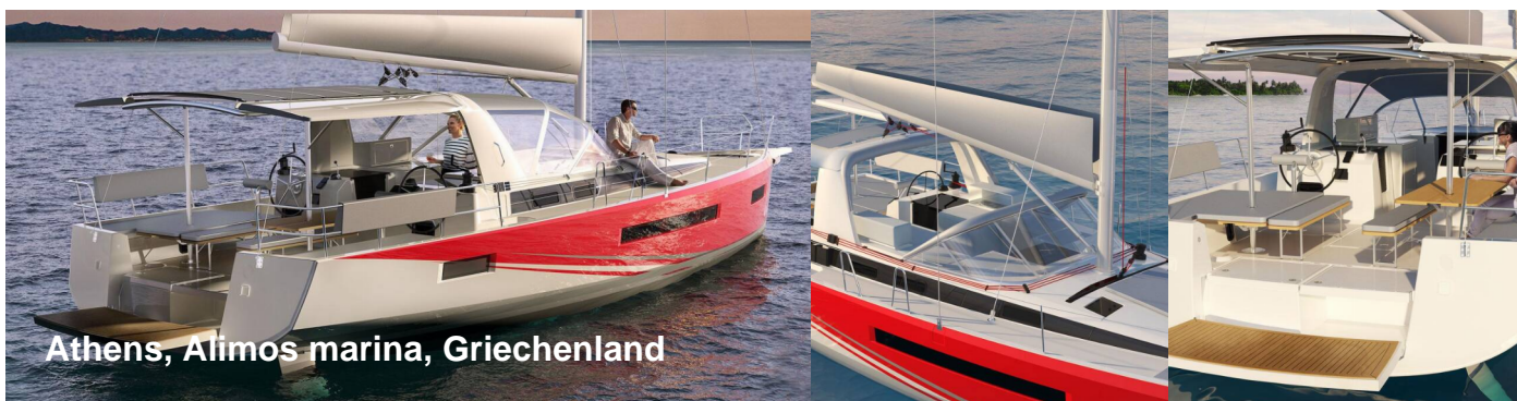
Athens, Alimos marina, Griechenland