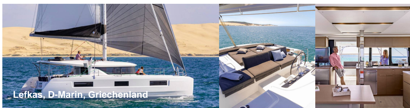
Lefkas, D-Marin, Griechenland