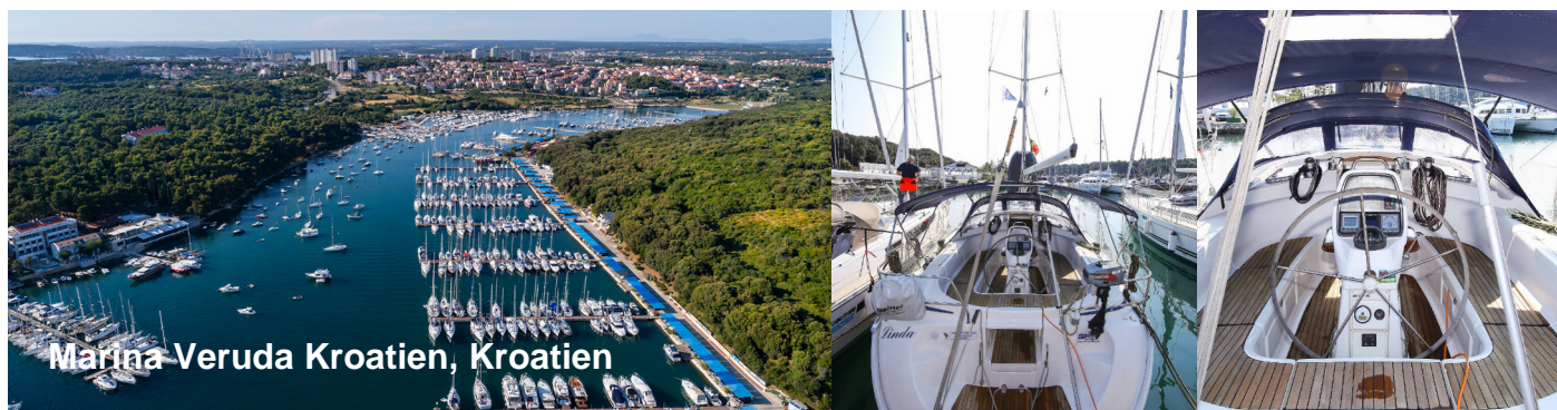
Marina Veruda Kroatien, Kroatien