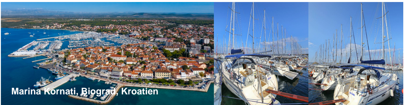
Marina Kornati, Biograd, Kroatien