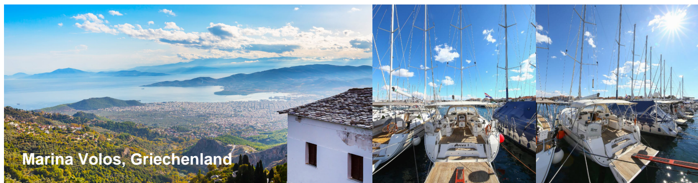
Marina Volos, Griechenland