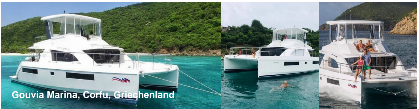
Gouvia Marina, Corfu, Griechenland