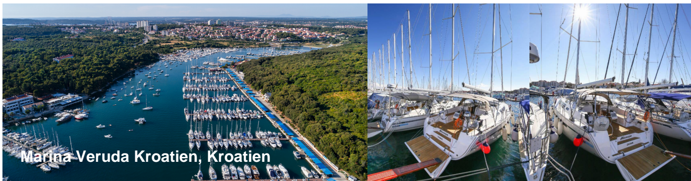
Marina Veruda Kroatien, Kroatien