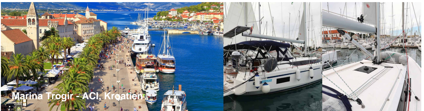
Marina Trogir - ACI, Kroatien