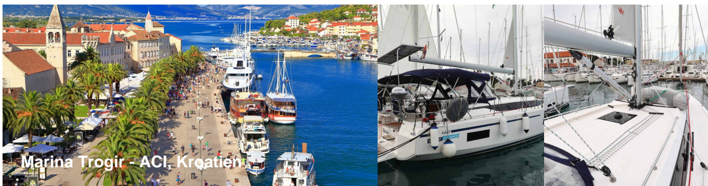
Marina Trogir - ACI, Kroatien