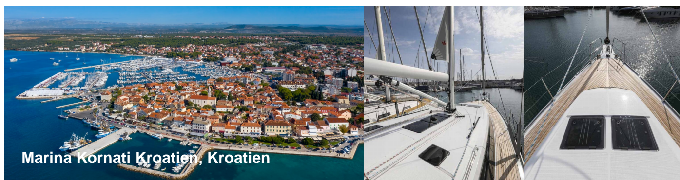
Marina Kornati Kroatien, Kroatien