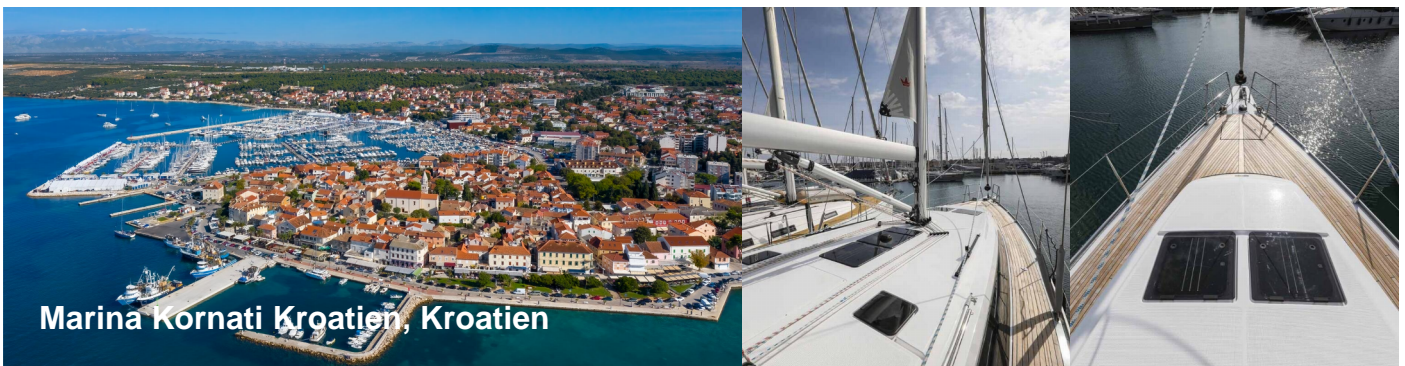
Marina Kornati Kroatien, Kroatien