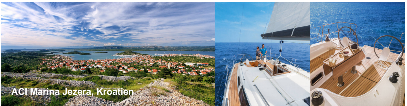
ACI Marina Jezera, Kroatien