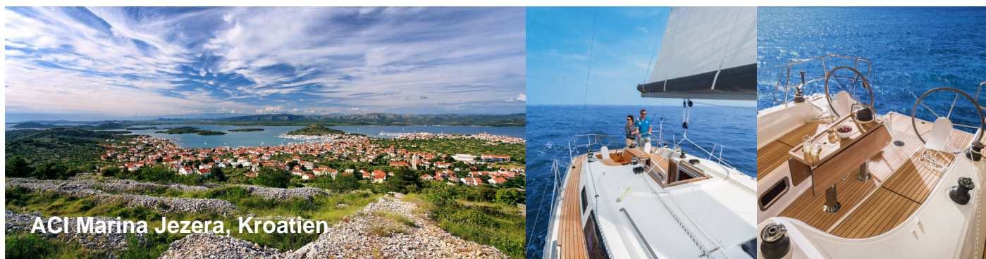
ACI Marina Jezera, Kroatien