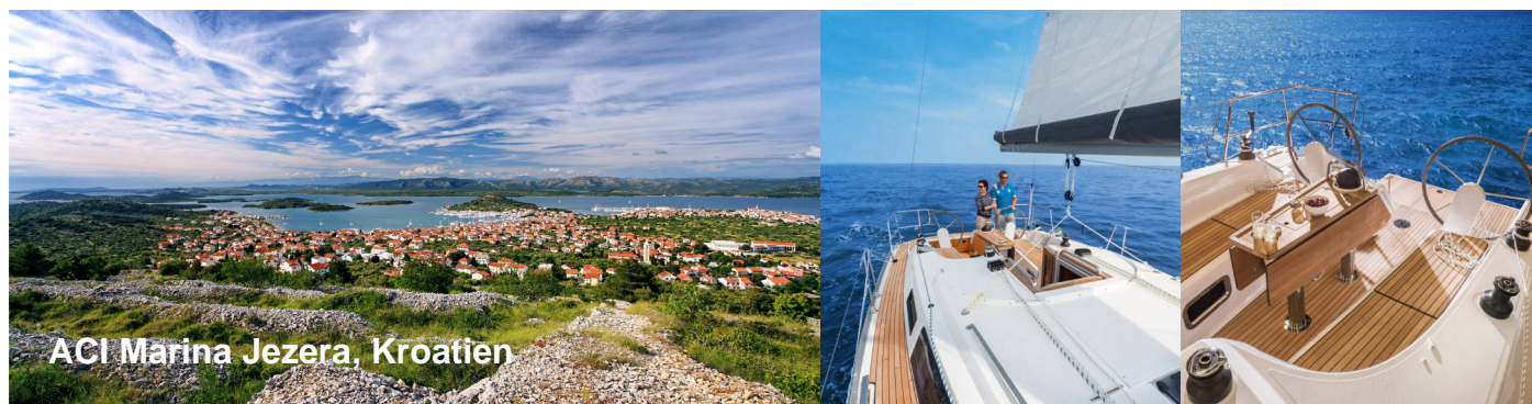
ACI Marina Jezera, Kroatien