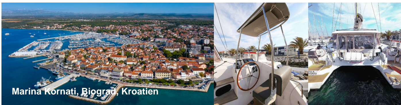
Marina Kornati, Biograd, Kroatien