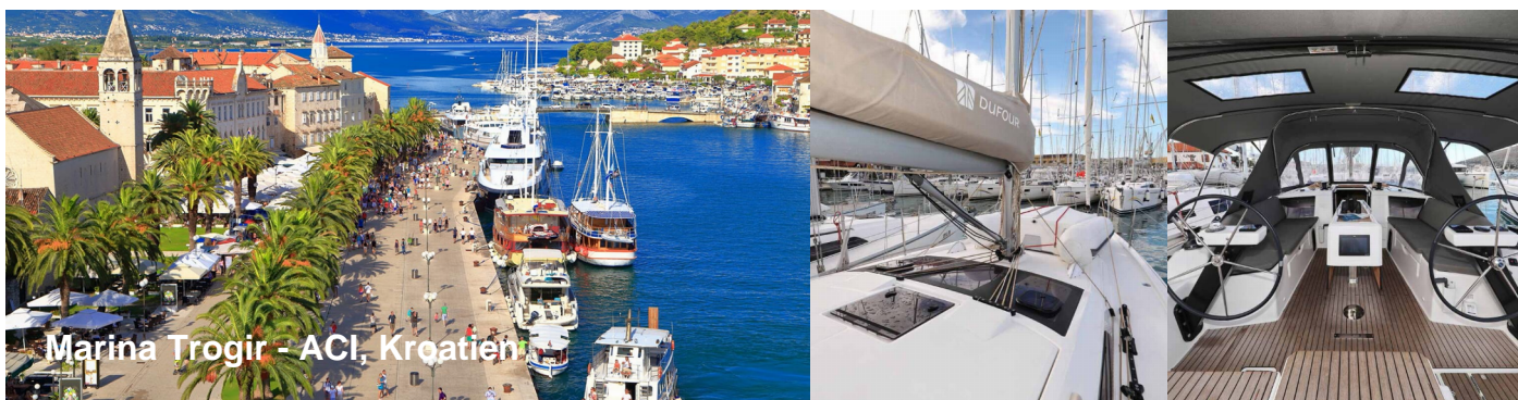
Marina Trogir - ACI, Kroatien