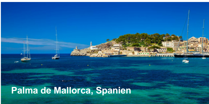
Palma de Mallorca, Spanien