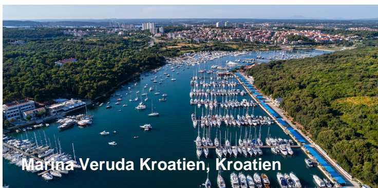
Marina Veruda Kroatien, Kroatien