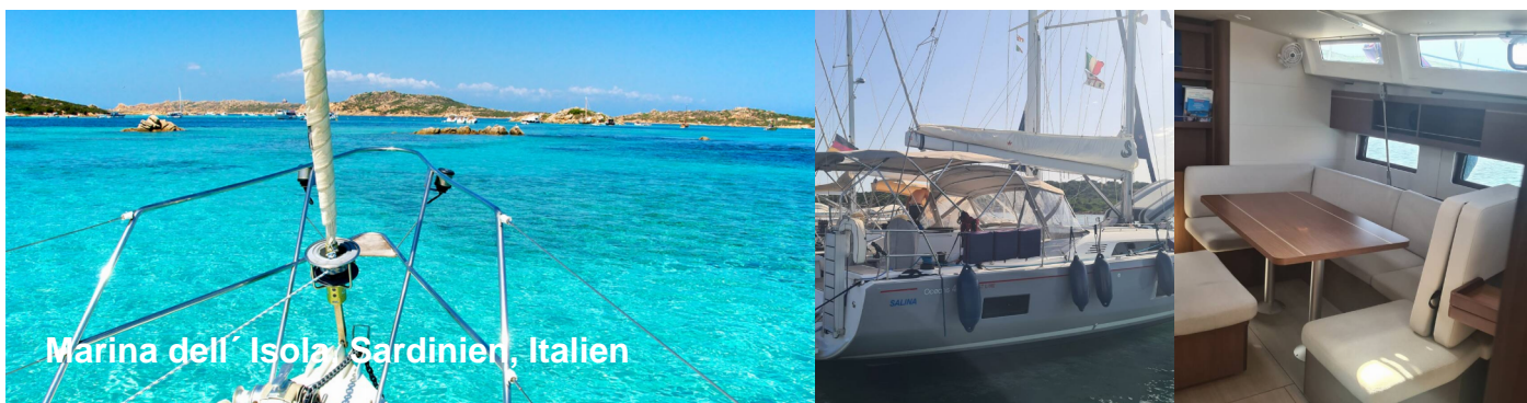
Marina dell' Isola Sardinien, Italien