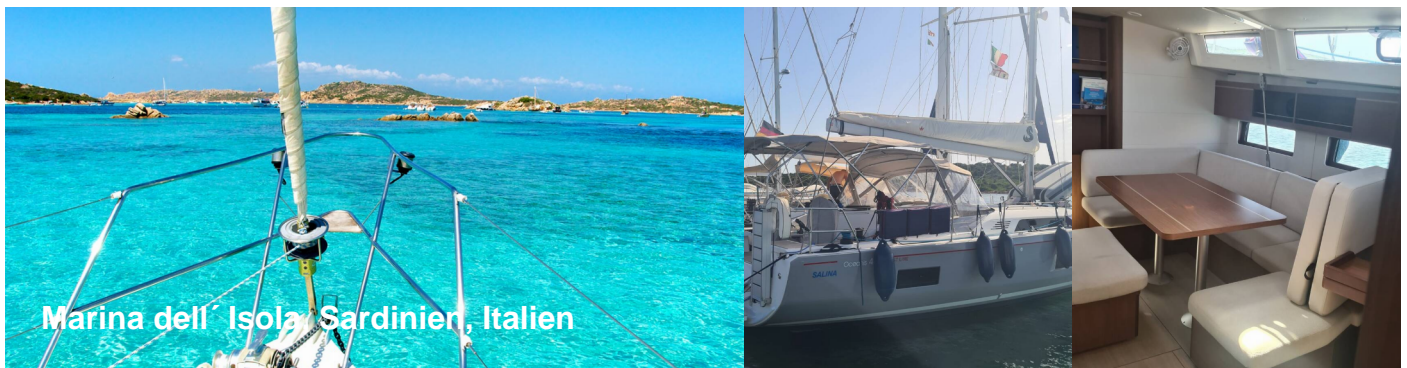
Marina dell' Isola Sardinien, Italien