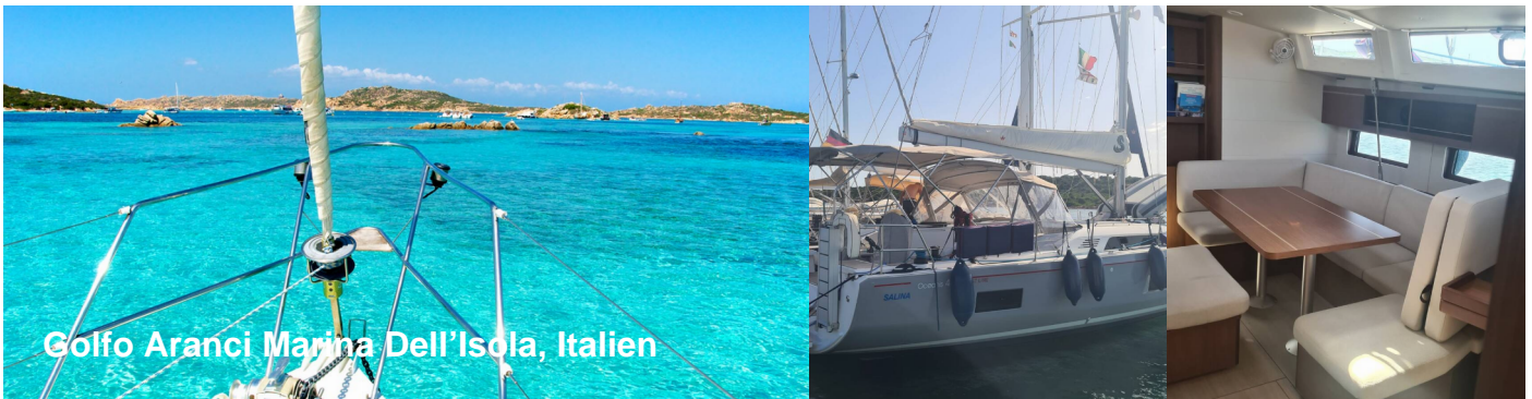
Golfo Aranci Marina Dell'Isola, Italien