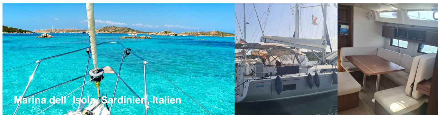
Marina dell' Isola Sardinien, Italien