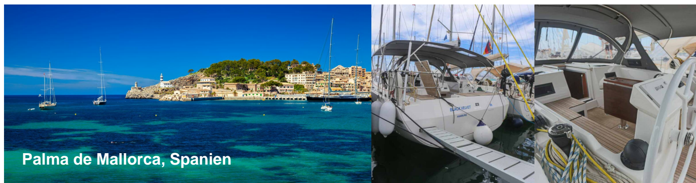
Palma de Mallorca, Spanien