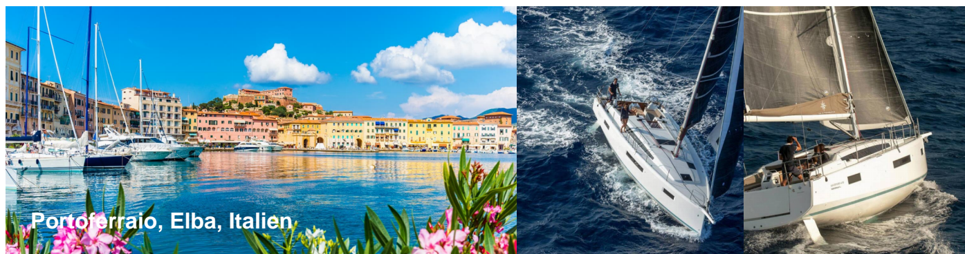
Portoferraio, Elba, Italien