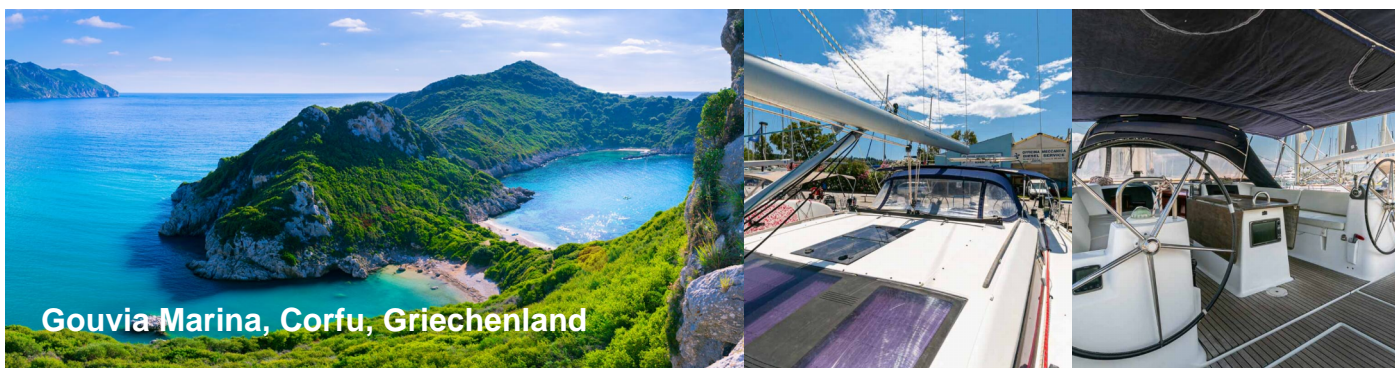
Gouvia Marina, Corfu, Griechenland