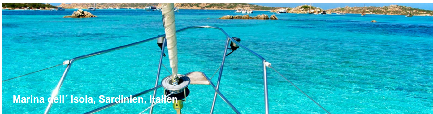
Marina dell'Isola, Sardinien, Italien