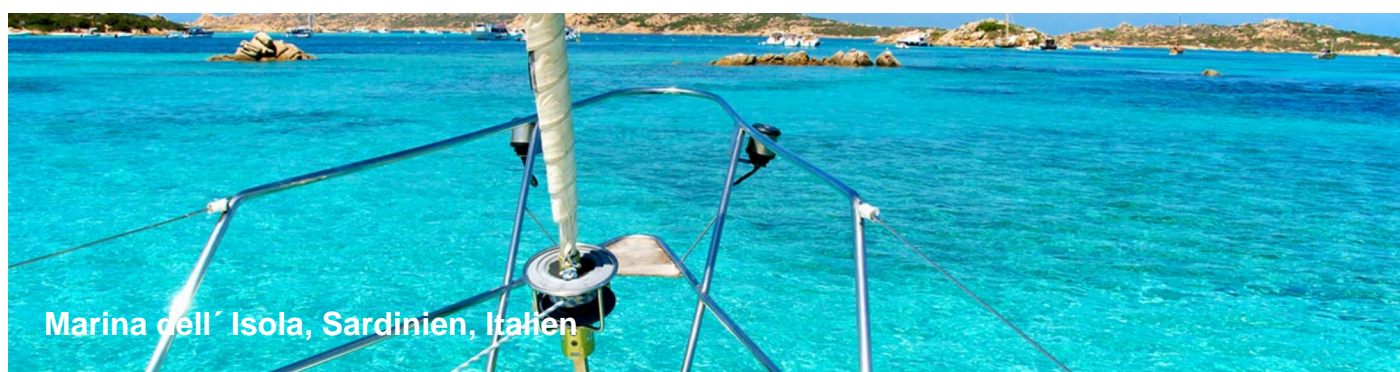
Marina dell'Isola, Sardinien, Italien