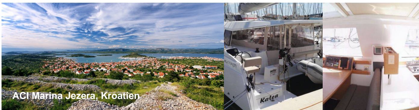
ACI Marina Jezera, Kroatien