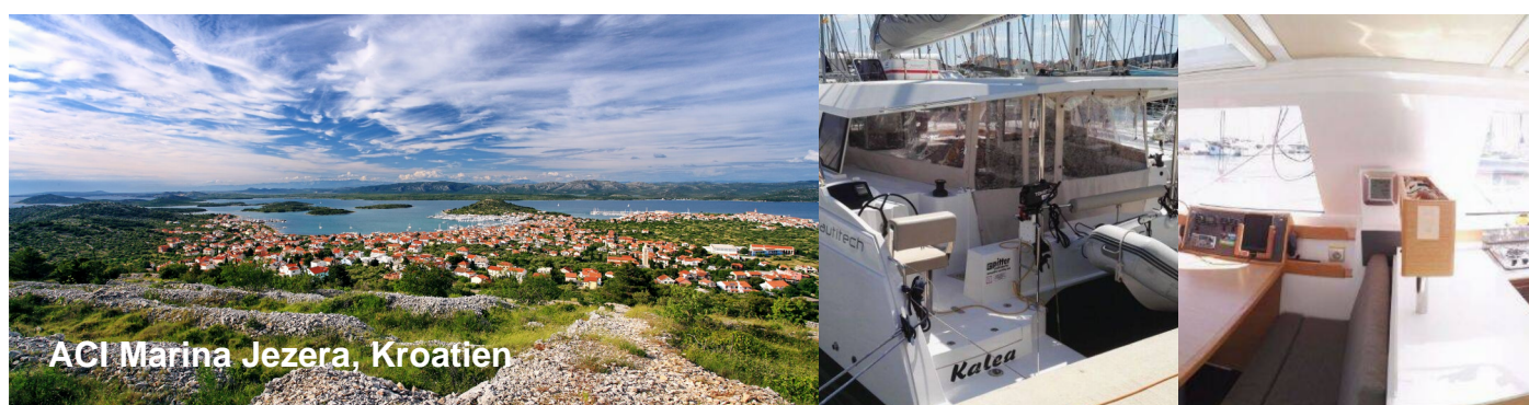
ACI Marina Jezera, Kroatien