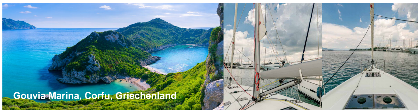
Gouvia Marina, Corfu, Griechenland