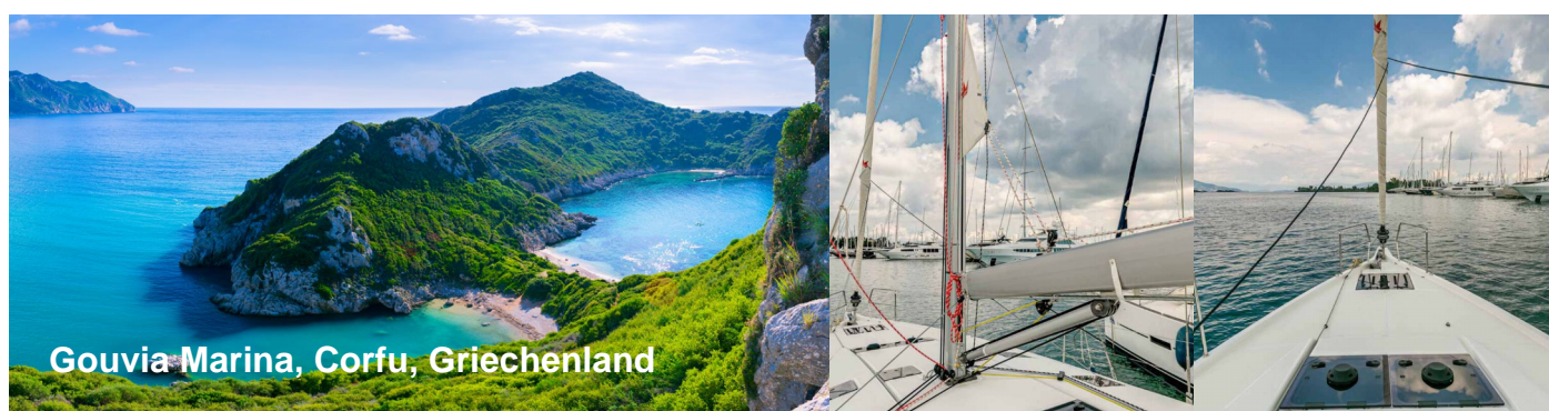
Gouvia Marina, Corfu, Griechenland