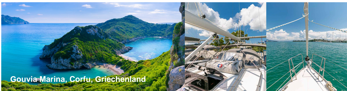
Gouvia Marina, Corfu, Griechenland