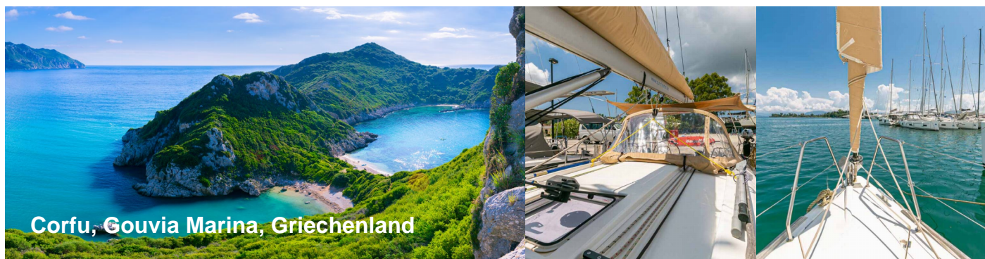
Corfu, Gouvia Marina, Griechenland