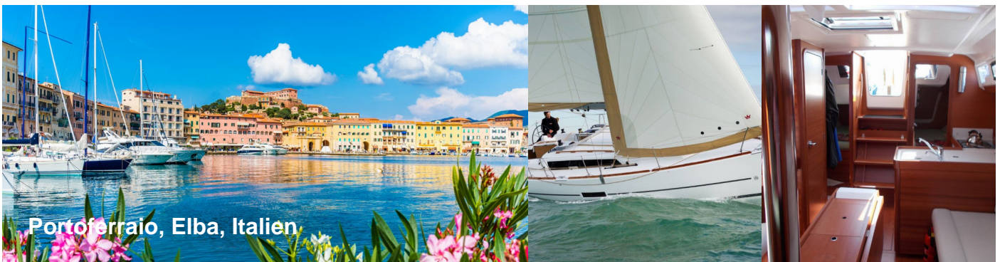
Portoferraio, Elba, Italien