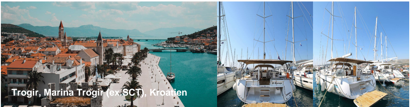
Trogir, Marina Trogir (ex-SCT), Kroatien