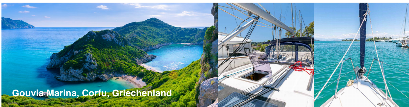
Gouvia Marina, Corfu, Griechenland