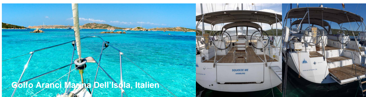
Golfo Aranci Marina Dell'Isola, Italien