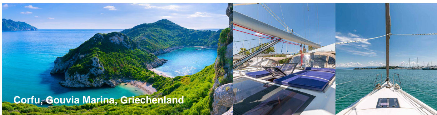
Corfu, Gouvia Marina, Griechenland