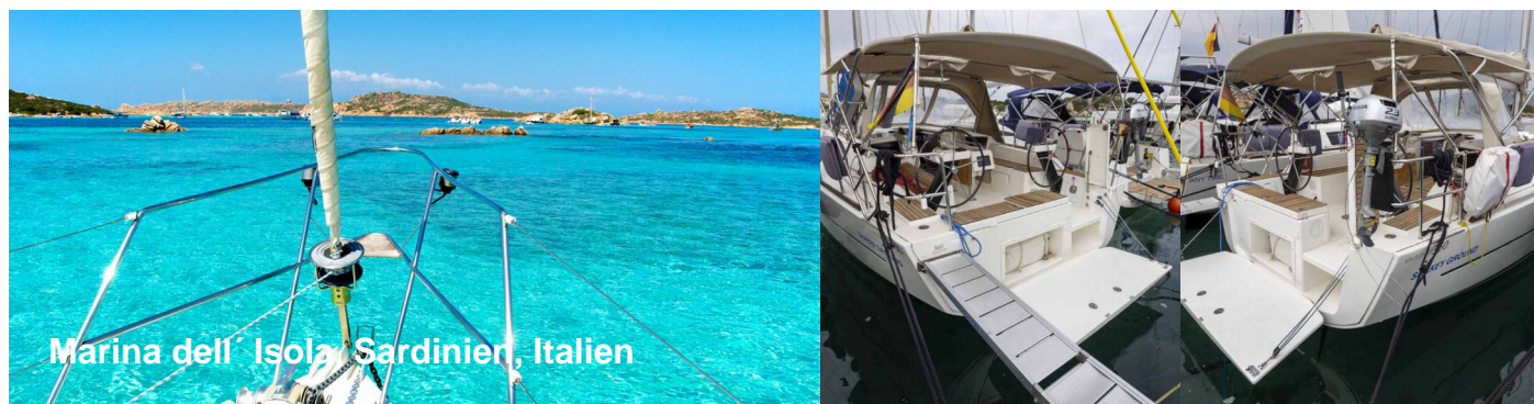
Marina dell' Isola Sardinien, Italien