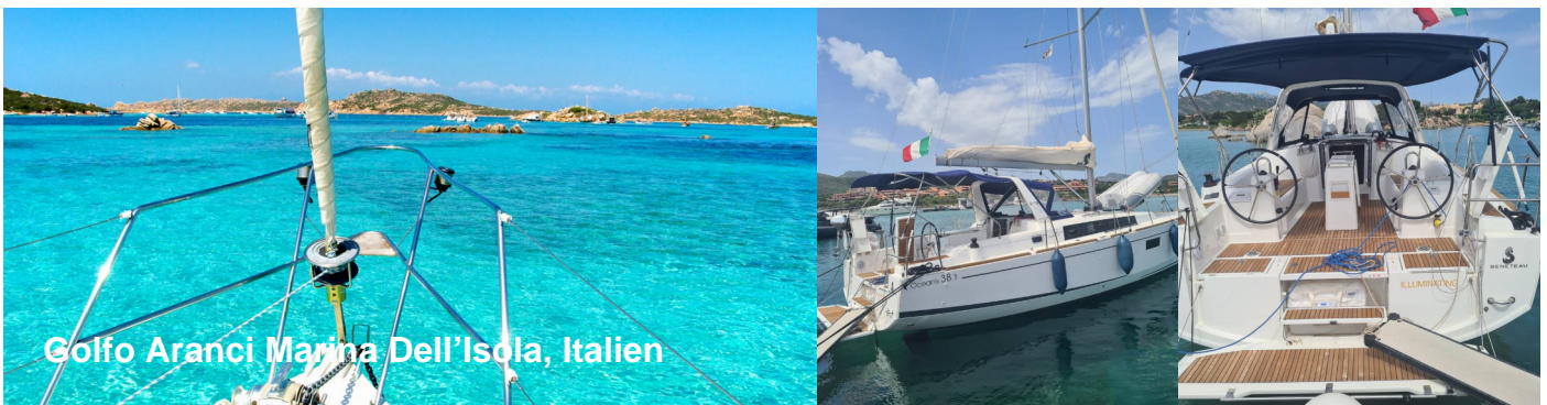
Golfo Aranci Marina Dell'Isola, Italien