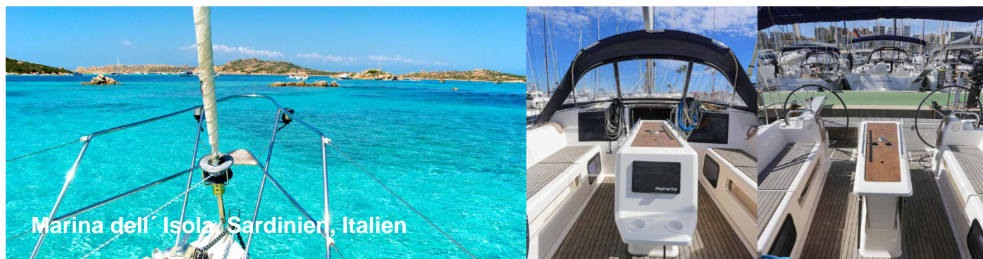
Marina dell' Isola Sardinien, Italien