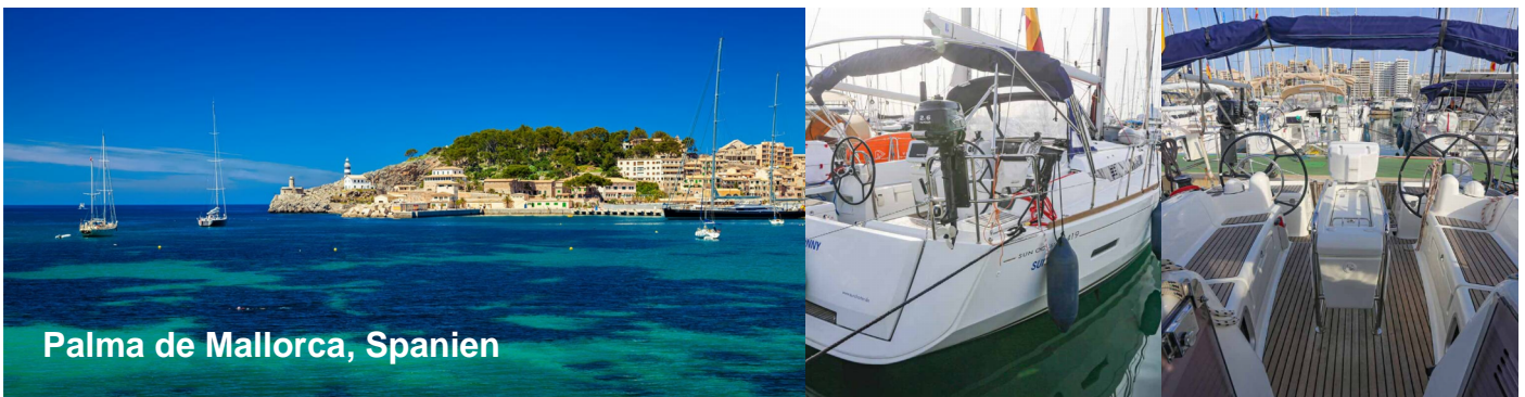
Palma de Mallorca, Spanien