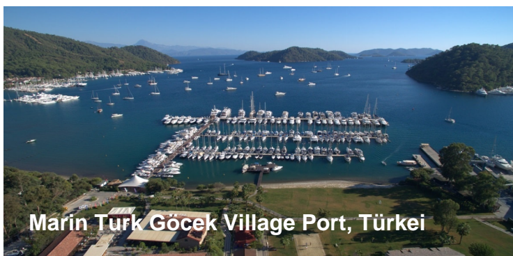
Marın Turk Göcek Village Port, Türkei