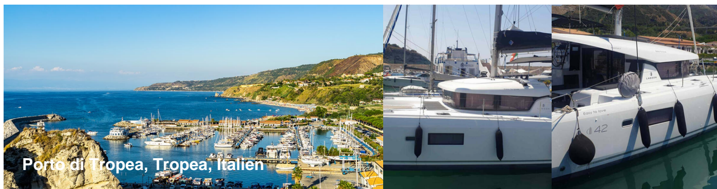
Porto di Tropea, Tropea, Italien