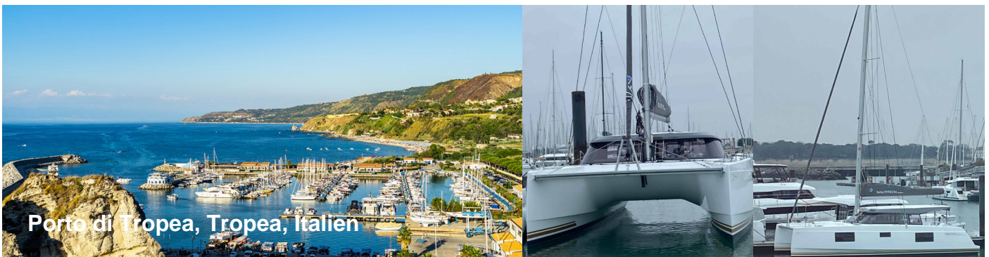
Porto di Tropea, Tropea, Italien