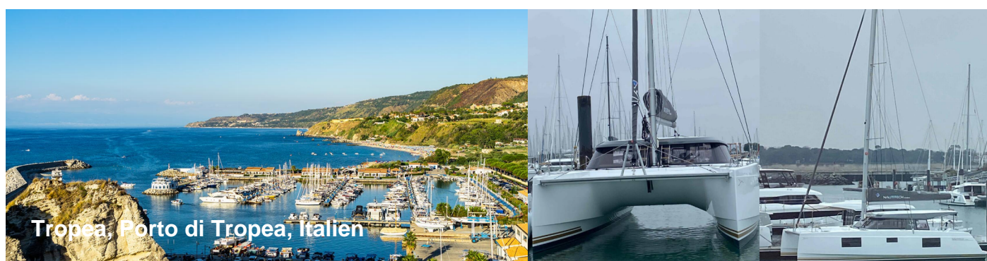
Tropea, Porto di Tropea, Italien