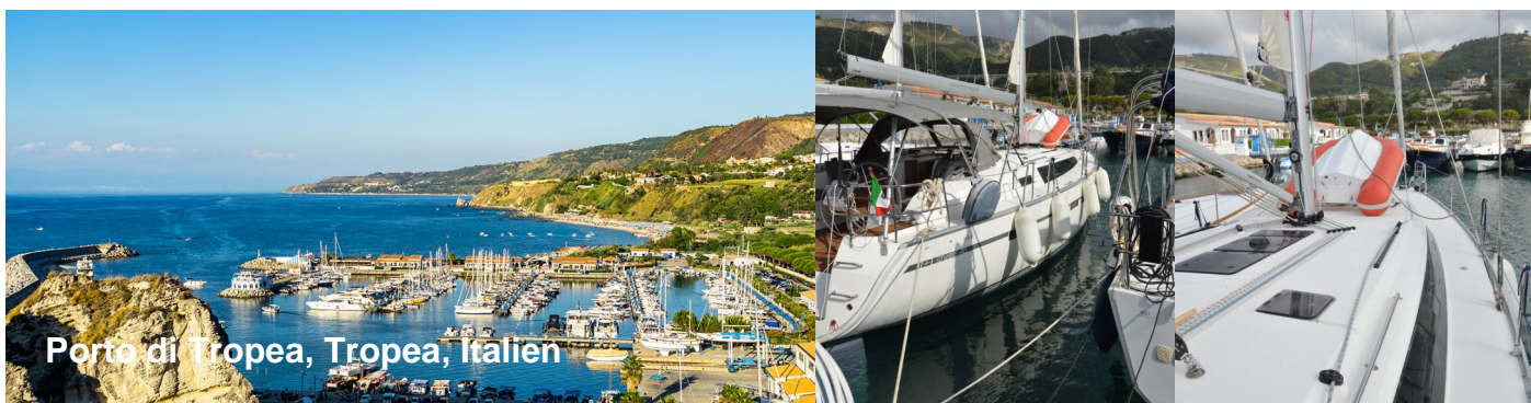
Porto di Tropea, Tropea, Italien