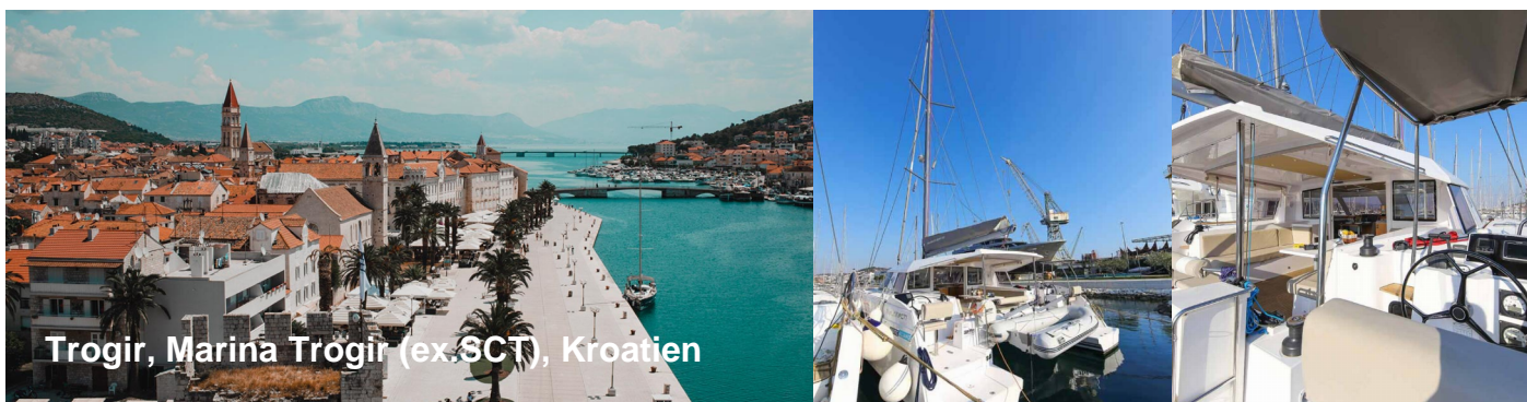
Trogir, Marina Trogir (ex. SCT), Kroatien