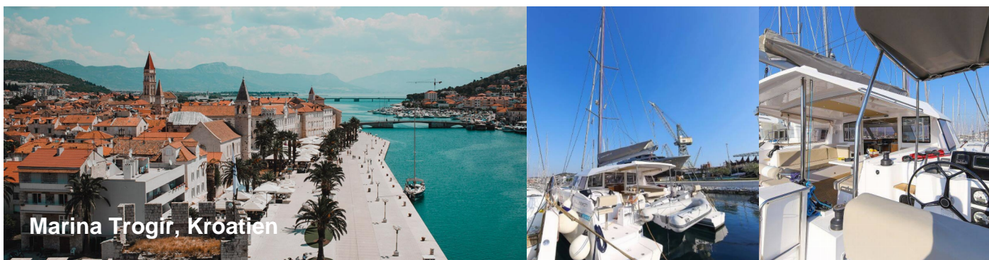
Marina Trogir, Kroatien