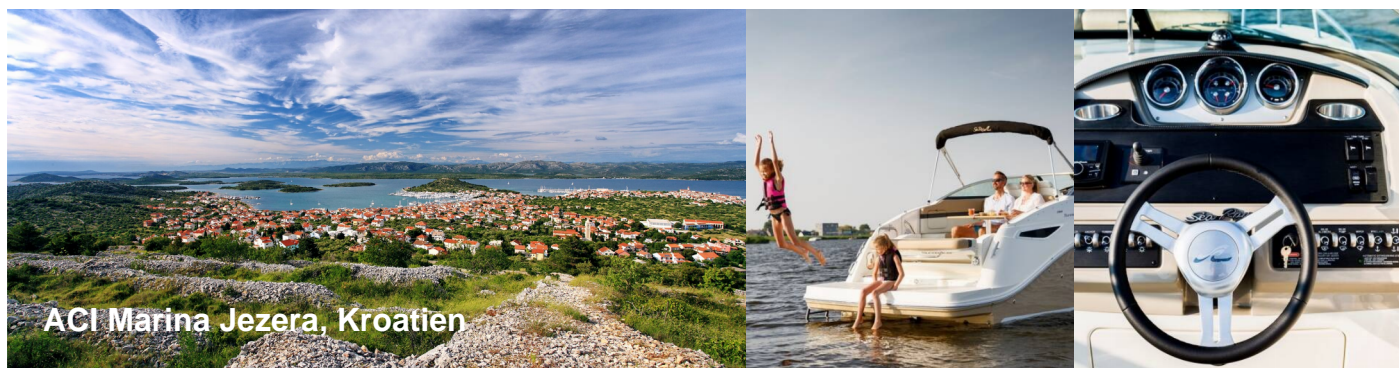
ACI Marina Jezera, Kroatien