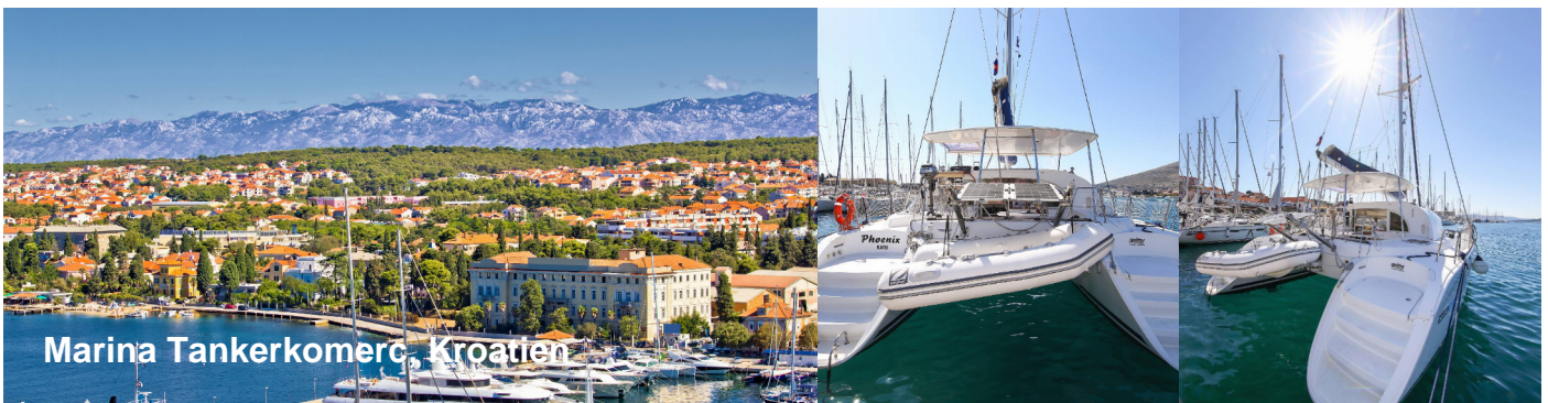
Marina Tankerkomerc, Kroatien