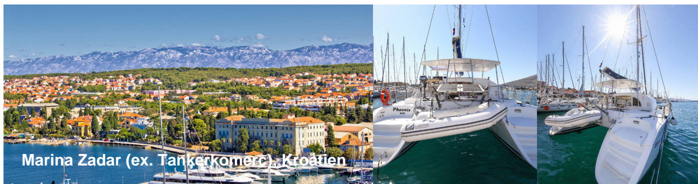
Marina Zadar (ex. Tankerkomerc), Kroatien