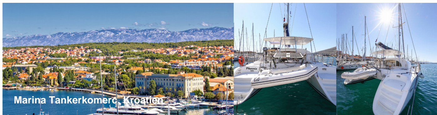
Marina Tankerkomerc, Kroatien