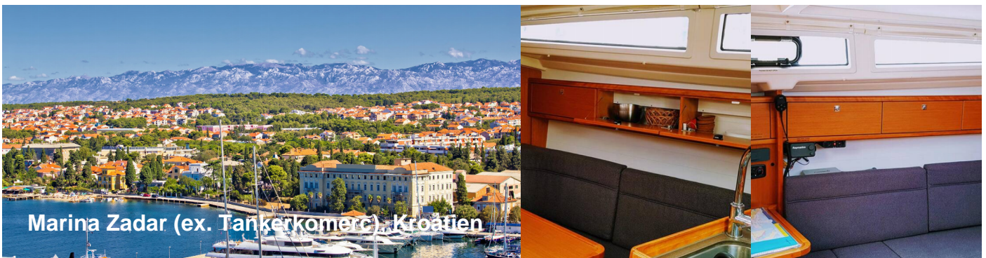
Marina Zadar (ex. Tankerkomerc), Kroatien