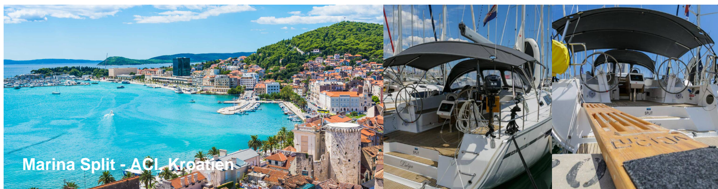
Marina Split - ACI Kroatien