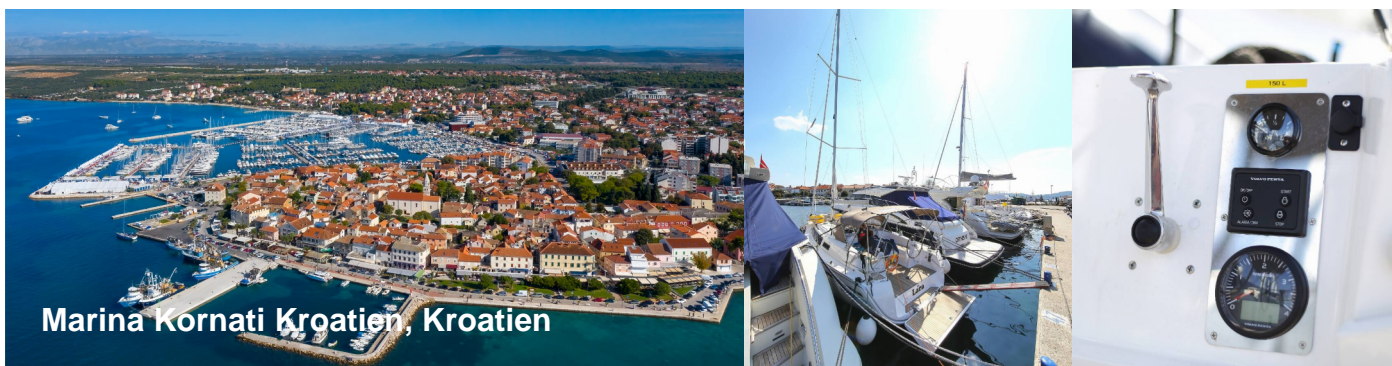
Marina Kornati Kroatien, Kroatien