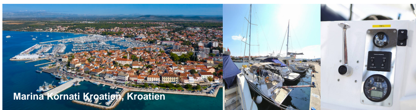
Marina Kornati Kroatien, Kroatien